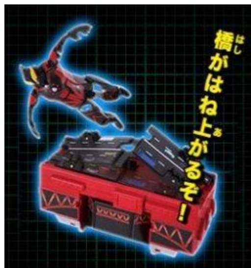
底面の車道が開き切った状態。