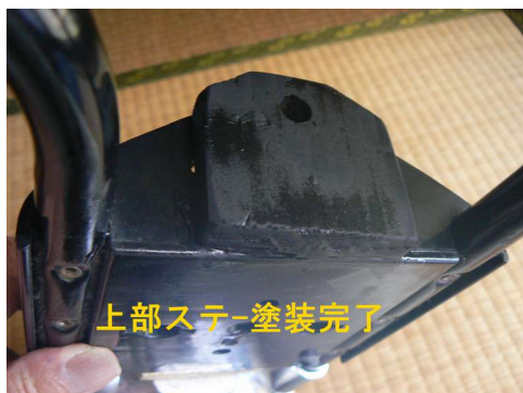
上部の部材塗装完了