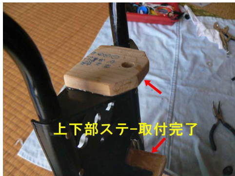
欠損部分の部材接着