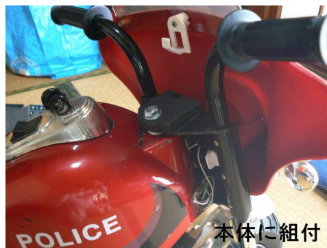
本体にハンドル組込み完了