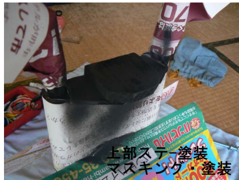
上部の部材塗装準備マスキング等