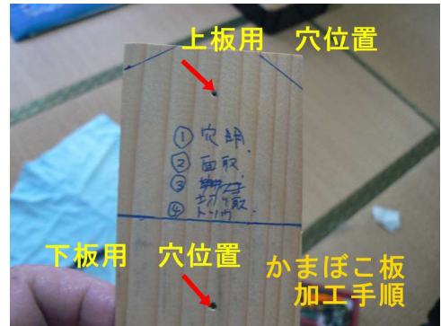
作業手順の下書き検討